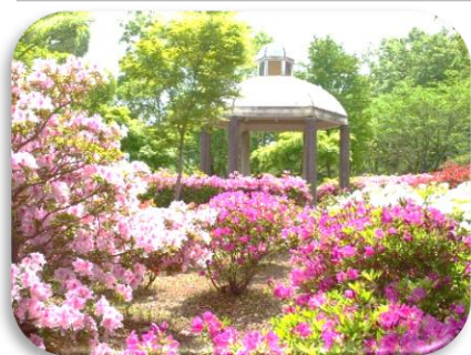
あつぎつつしの丘公園