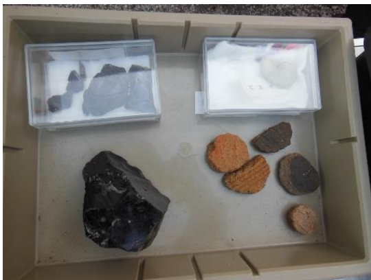
平成27年度発掘品とヒスイ（上の右上）

今回の発掘調査で調査員の方から全域に住居跡が出てきたと聞いています。私が住む地域が4千年前の往古から居住地だったことを知り歴史の流れに思いをはせながら、今回の発掘による新たな発見を期待しています。