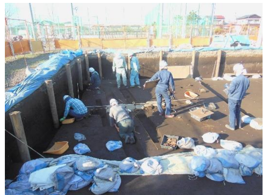
令和2年度の発掘作業