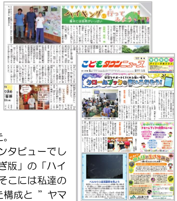
タウンニュース社ホームページより

https://www.townnews.co.jp/data/book/kodomotown/atsugi2107/?pNo=1